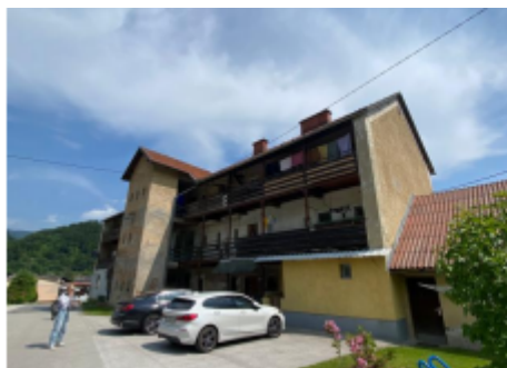
Pogled : večstanovanjski objekt, Naselje na Šahtu 15, 1412 Kisovec