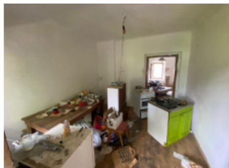
Pogled : soba