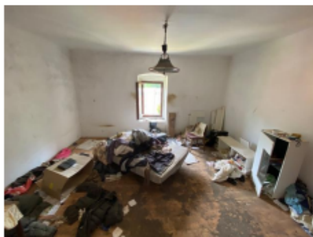
Pogled : soba